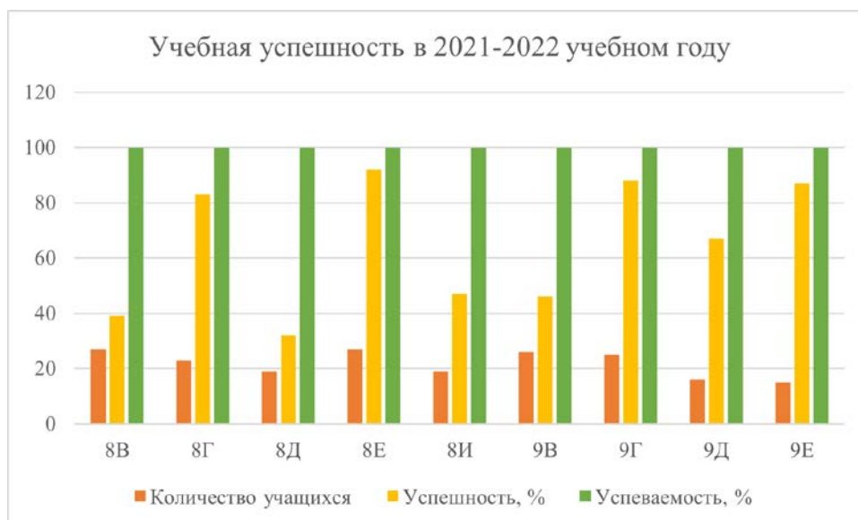
ДИАГРАММА. Учебная успешность в 2021-2022 учебном году.