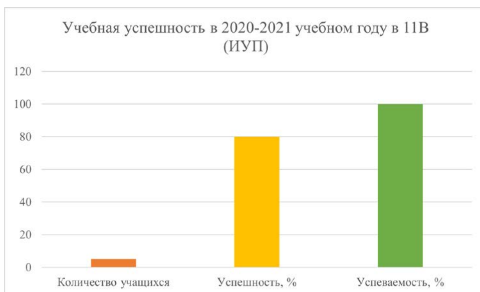
ДИАГРАММА. Учебная успешность в 2020-2021 учебном году.